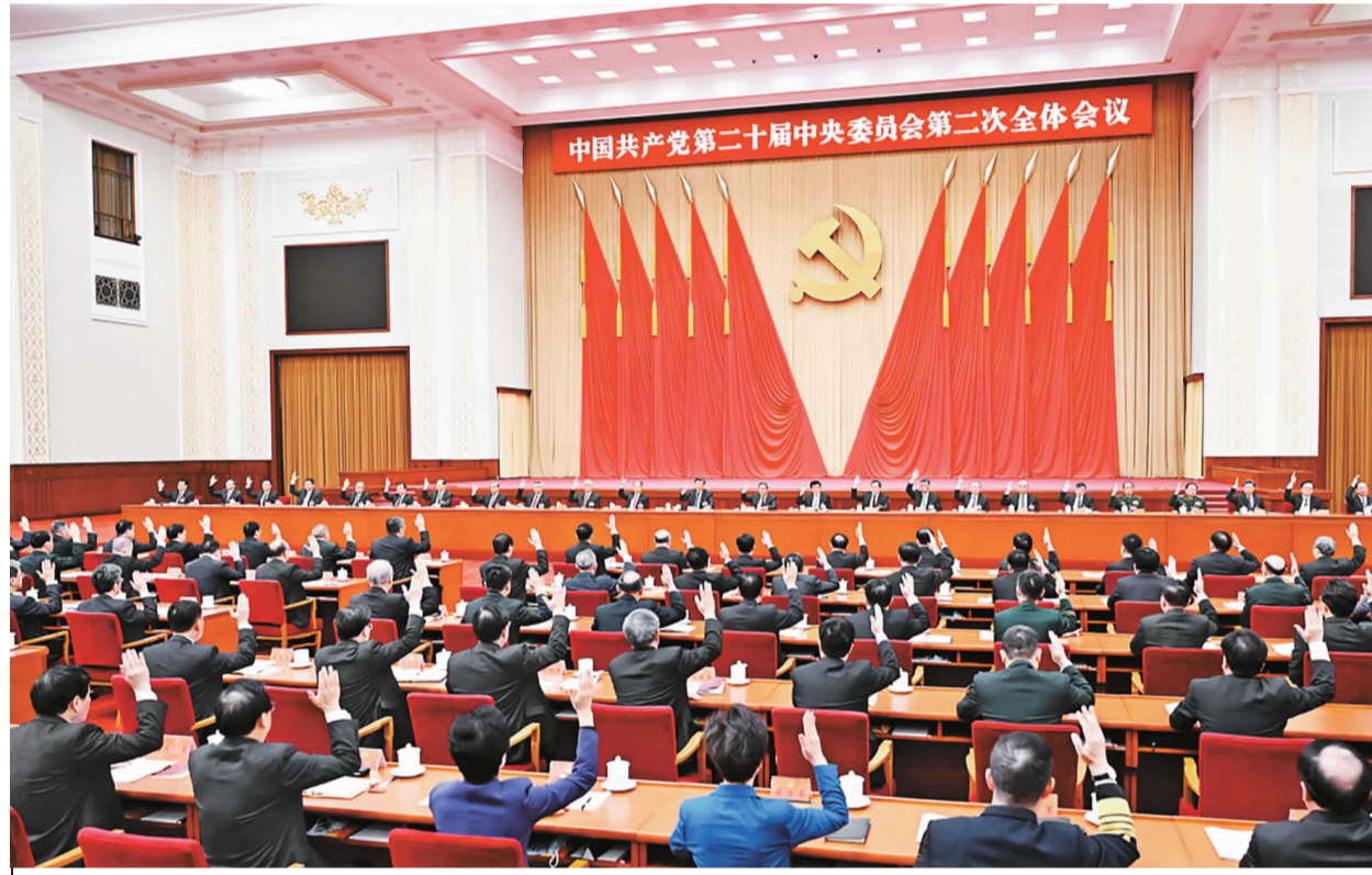
中国共产党第二十届中央委员会第二次全体会议,于2023年2月26日至28日在北京举行。中央政治局主持会议。