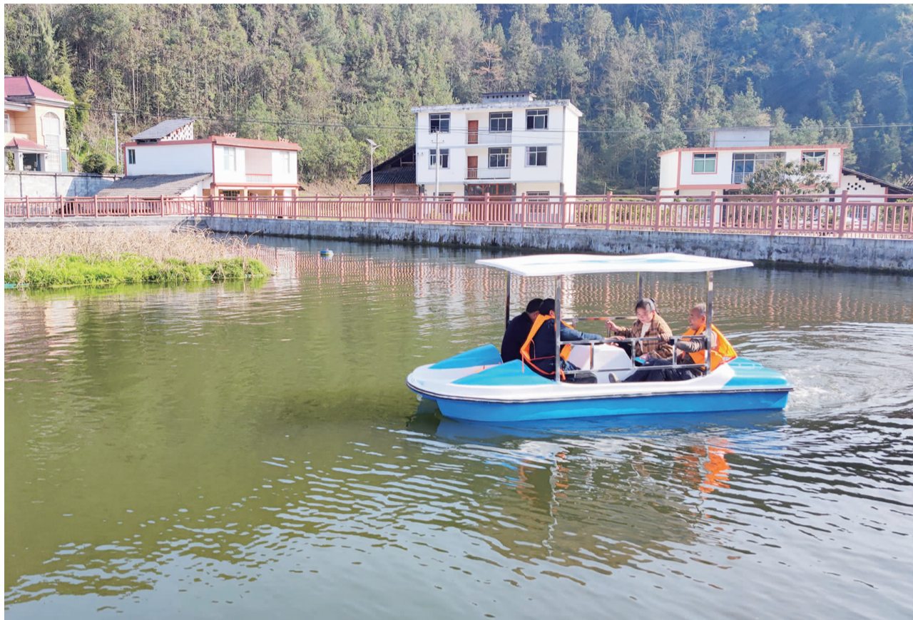
游客在区阳村玩耍。