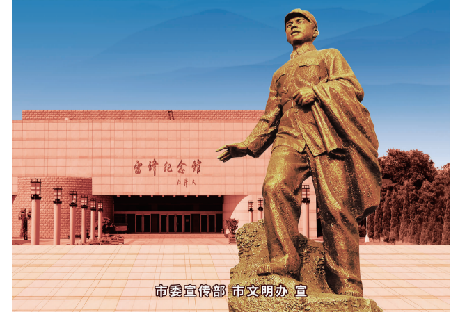
市委宣传部 市文明办 宣