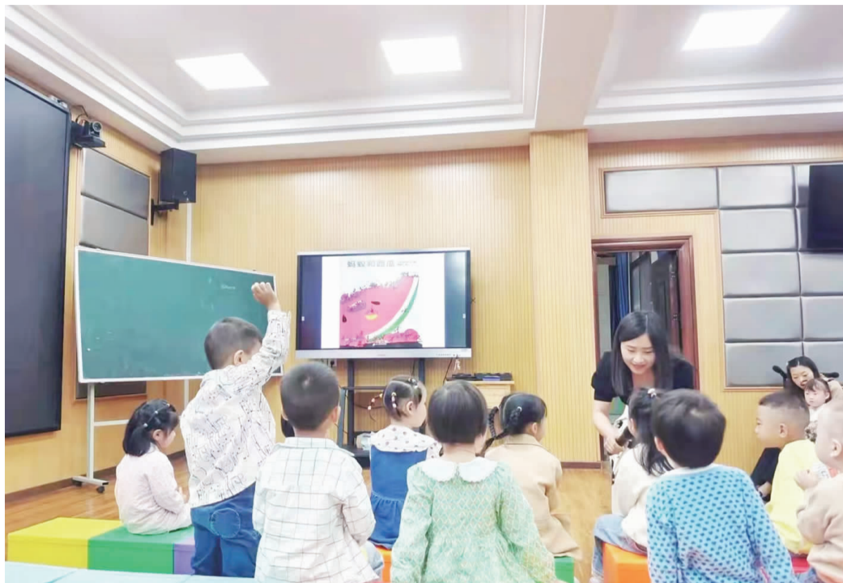
老师正在给孩子们上课。